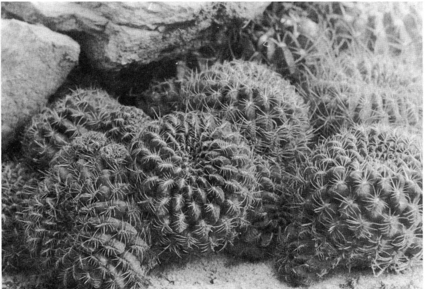
Sulcorebutia oenantha Rausch spec. nov.

Bloem 35 mm lang en breed; pericarpellum en receptaculum oranje-bruin met groene schubjes: buitenste perianthbladeren wijnrood met bruingroene punt; binnenste perianthbladeren donker wijnrood; keel rose; meeldraden direct boven het pericarpellum beginnend, donkerrose; stijl geel; stempels 6, geel.